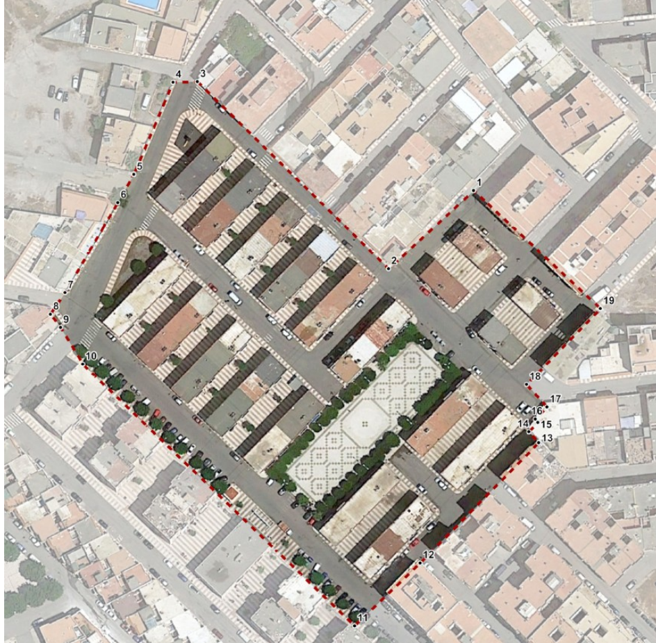
Coordenadas UTM ETRS89 Huso 30