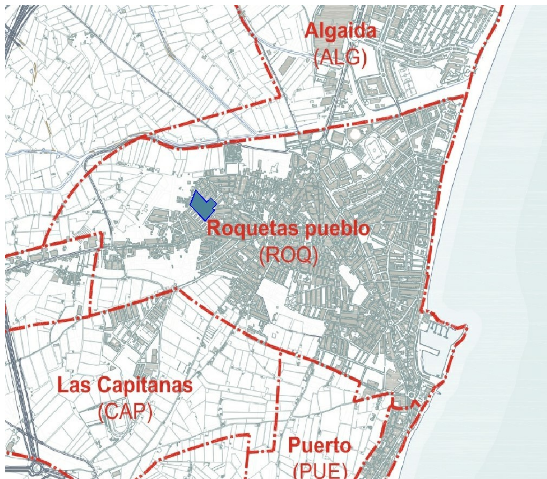
Imagen 2: Plano de la emplazamiento del ERRP.

Los inmuebles y superficies que se proponen como ámbito de actuación son los pertenecientes a esta zona del núcleo urbano más antiguo y debilitado desde un punto de vista constructivo y, en consecuencia, energéticamente.